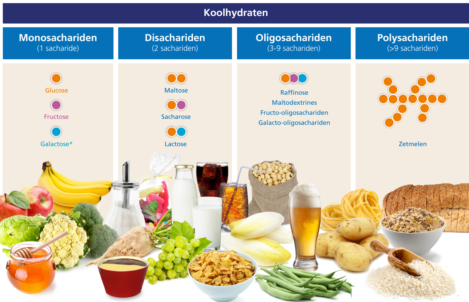
Figuur 1. Verschillende koolhydraten (opgedeeld in ketenlengte) en voedingsmiddelen waar zij in voorkomen. *Galactose komt niet 'vrij' voor, maar gebonden aan glucose in de vorm van lactose.

Monosachariden bestaan uit één sacharide. Voorbeelden zijn: glucose, fructose en galactose.