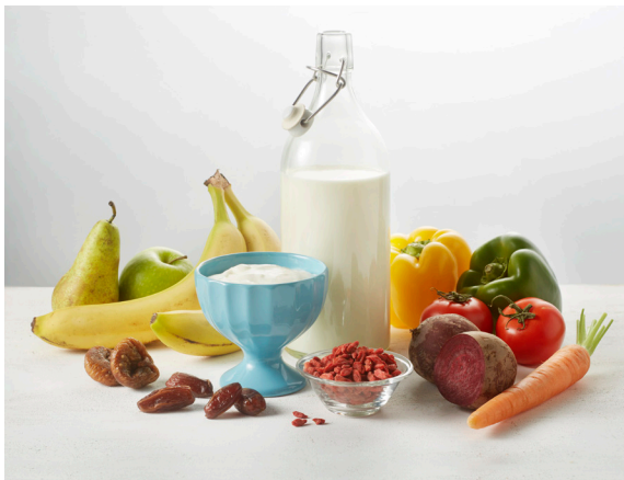
Figuur 4. Voedingsmiddelen met van nature aanwezige suikers.

Suikers worden vaak onderverdeeld in 'van nature aanwezige suikers' en 'toegevoegde suikers'. Van nature aanwezige suikers zijn de mono- en disachariden die van nature voorkomen in onbewerkte producten zoals groente, fruit en zuivel (figuur 4). Met toegevoegde suikers worden alle mono- en disachariden bedoeld die door consument, kok of industrie worden toegevoegd aan de voeding (figuur 5). Het menselijk lichaam maakt geen onderscheid tussen toegevoegde en van nature aanwezige suikers, het molecuul is immers exact hetzelfde.