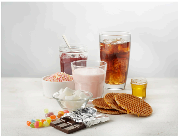
Figuur 5. Voedingsmiddelen met toegevoegde suikers.