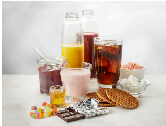
Figuur 6. Voedingsmiddelen met vrije suikers.

De Wereldgezondheidsorganisatie 9 , de Scientific Advisory Committee on Nutrition (het Britse voedingsadviesorgaan) 10 en de Nederlandse Diabetes Federatie 11 hanteren in hun meest recente adviesrapporten de term 'vrije suikers'. Vrije suikers zijn alle monosachariden en disachariden die toegevoegd zijn door de producent, kok of consument en suikers die van nature aanwezig zijn in honing, siropen, vruchtensappen en vruchtenconcentraat (figuur 6). Van nature aanwezige suikers in fruit, groente en zuivel vallen hier niet onder.