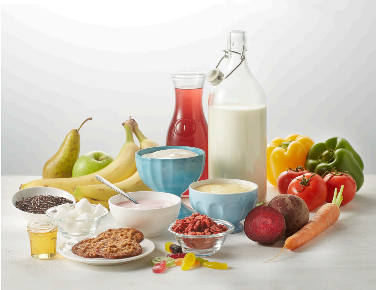
Figuur 2. Voedingsmiddelen met van nature aanwezige en/of toegevoegde suikers.